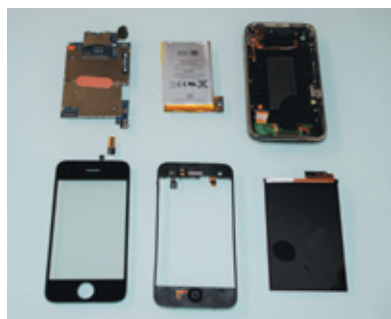
写真3 iPhoneは、写真の下段左からガラス+タッチパネル/フレーム/液晶、上段左から基盤やカメラ、Dock/バッテリー/バックパネル——というように6層に分解できる

表「あいらぼ」では、液晶の修理のほかにバッテリーの交換にも対応してくれる。バッテリーと液晶を同時に交換すると、「バリューセット」として液晶交換代金プラス3000円と得だ。iPhoneの水没にも対応している