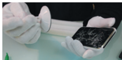
写真2 iPhoneの液晶パネルは本体下部のネジを外せば取れる。液晶の割れがひどい場合はガラスパネルが取れにくいので、液晶に粘着テープを張ったうえで吸盤を付けて取り外している